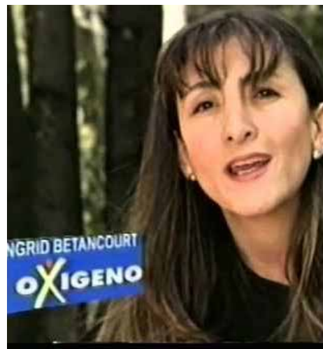
2002. Ingrid Betancourt fue candidata por el Partido Verde Oxígeno. Ese año fue secuestrada por las Farc. Fue rescata en 2008 por el Ejército.