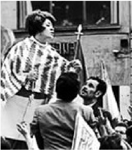
1974. María Eugenia Rojas de Moreno, por la Anapo, fue la primera mujer en aspirar a la Presidencia.