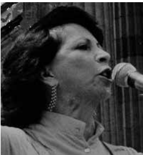
1998. Regina Betancourt de Liska fue secuestrada al iniciar su campaña presidencial. No pudo inscribirse oficialmente.