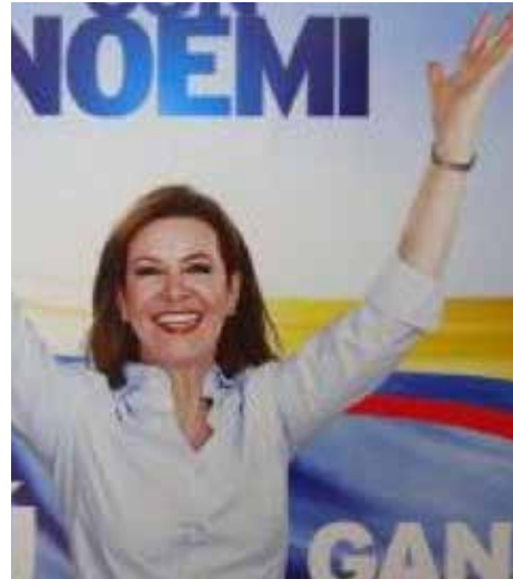
1998. Noemí Sanín Posada fue la segunda mujer en aspirar a la Presidencia. En 2010 fue candidata otra vez.